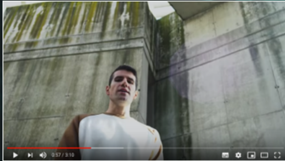
About a Better Me (Official Video)